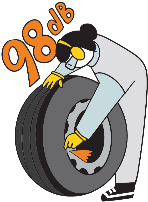
Venttiilin sielun irrotus

Kuulonsuojaimien käyttöraja on 85 dB (desibeliä)