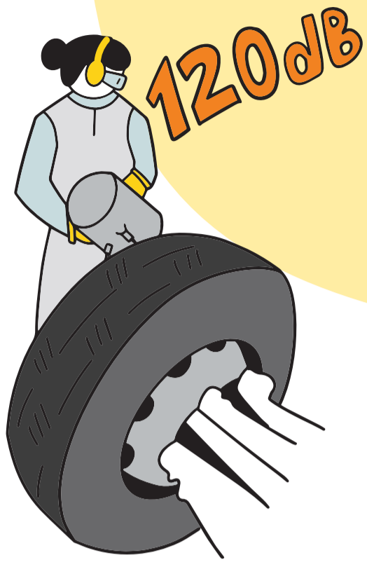
Renkaan asennus ilmatykillä