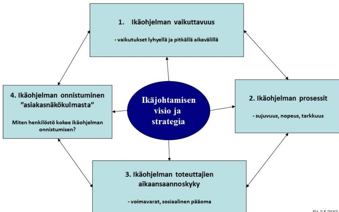
Kuvio 3. Ikäohjelman onnistumisen arviointi tasapainotetun mittariston avulla